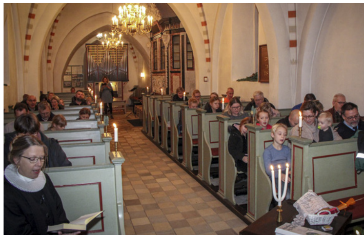
Bråby Kirke var godt fyldt til familiegudstjenesten i begyndelsen af det nye år. En del af dem var børn og forældre i kirkens børneklub.